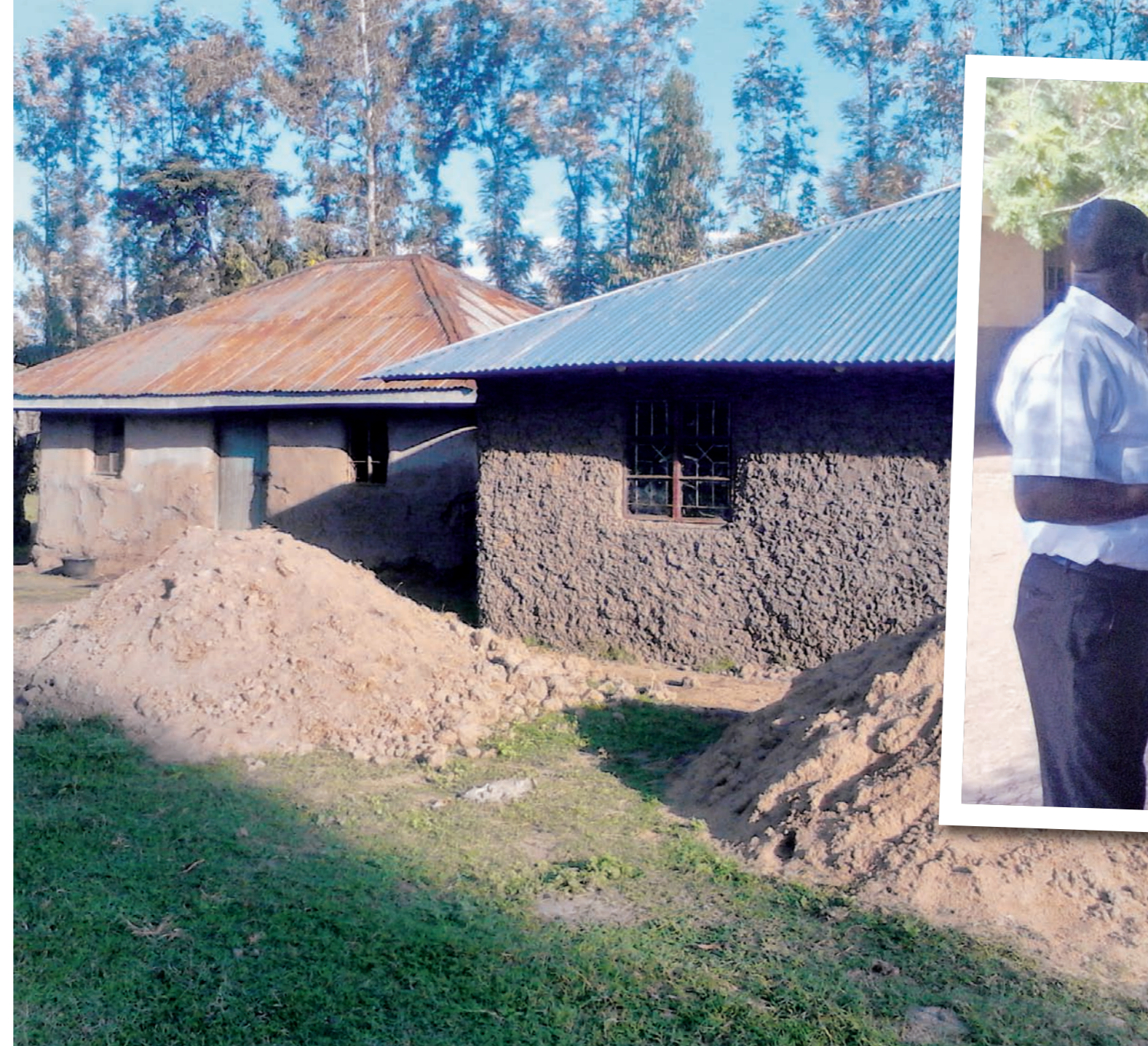
Orpokoti joulukuussa 2013, vieressä vanha asuinrakennus.

Syötävää, juotavaa, arvontaa ja hyvää mieltä Kesäisillä biiseillä ja lastenlauluilla viihdyttämässä Rytmiyhmä klo 12 ja 16 Tuotto menee Keniaan orpokodin rakentamiseen