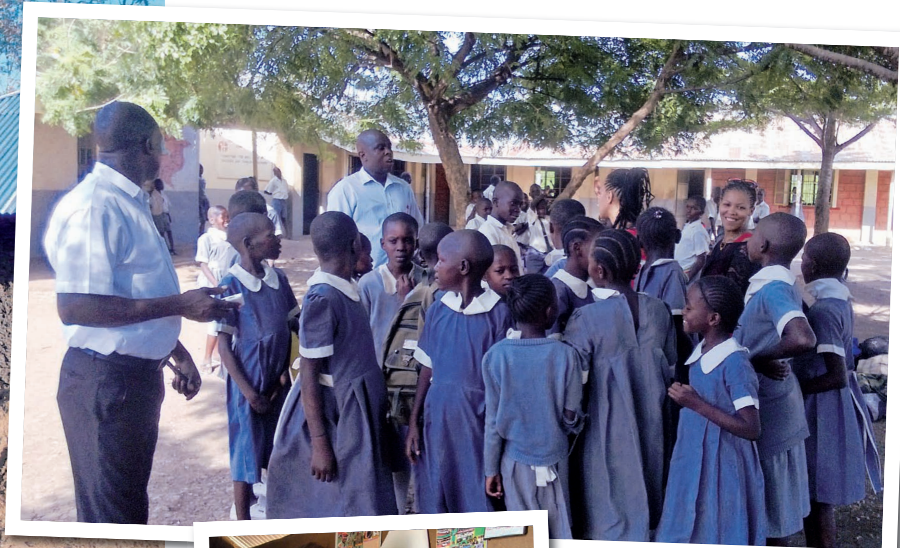
Vierailimme Okanja-koululla, jossa lapsiamme opiskeli. Koulun rehtori (vas.) kertoi meille koskettavan tarinan, kuinka hän oli Ahero Hope Centerin ja Bondoaidin kaltaisen järjestön ansioista pystynyt käymään koulut loppuun, hän oli itsekin orpo.

Harmiksemme talo ei ollutkaan ehtinyt valmistua, taloon varattua hankerahaa oli jouduttu käyttämään myös ruokaan sen puuttuessa kokonaan, tiet olivat olleet pois käytössä sateiden takia ja rakennusmateriaaleja oli myös varastettu. Elämä Keniassa on erilaista ja tällaiset arkipäivää, paras on vain "go with a flow" ja olla murehtimatta liikaa :) Onneksi ihmiset, joiden kanssa työskentelemme ovat todella rehellisiä sekä alueella tunnettuja ja arvostettuja.